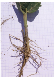
Premières nodosités bien en place

➤ Soja : Depuis le semis, les sojas ont bénéficié de conditions idéales. Les levées ont été souvent bonnes et homogènes. Le développement de la culture est rapide, les parcelles arrivent souvent au stade première feuille trifoliés. Les premières nodosités sont souvent visibles. Les interventions mécaniques (houe/herse étrille) ont souvent déjà été réalisées. Les premiers binages peuvent débuter. Ne vous laissez pas dépasser par les adventices.