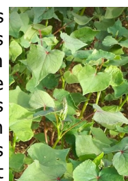
Sarrasin semé à la mi-mai

➤ Sorghos et Sarrasins : Les semis de la mi-mai sont déjà bien développés alors que les derniers sont tout juste en ligne. Les sorghos multicoups et le sarrasin sont souvent très étouffants rapidement. Il est rare d'avoir besoin d'intervenir mécaniquement. Pour les sorghos ensilage, les densités sont moindres et la culture se gère comme un maïs. N'hésitez pas à intervenir en post-levée mécaniquement si besoin (herse puis binage).